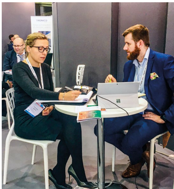
Podnikatelská mise do Milána a Turína 25.–27. 11. 2019