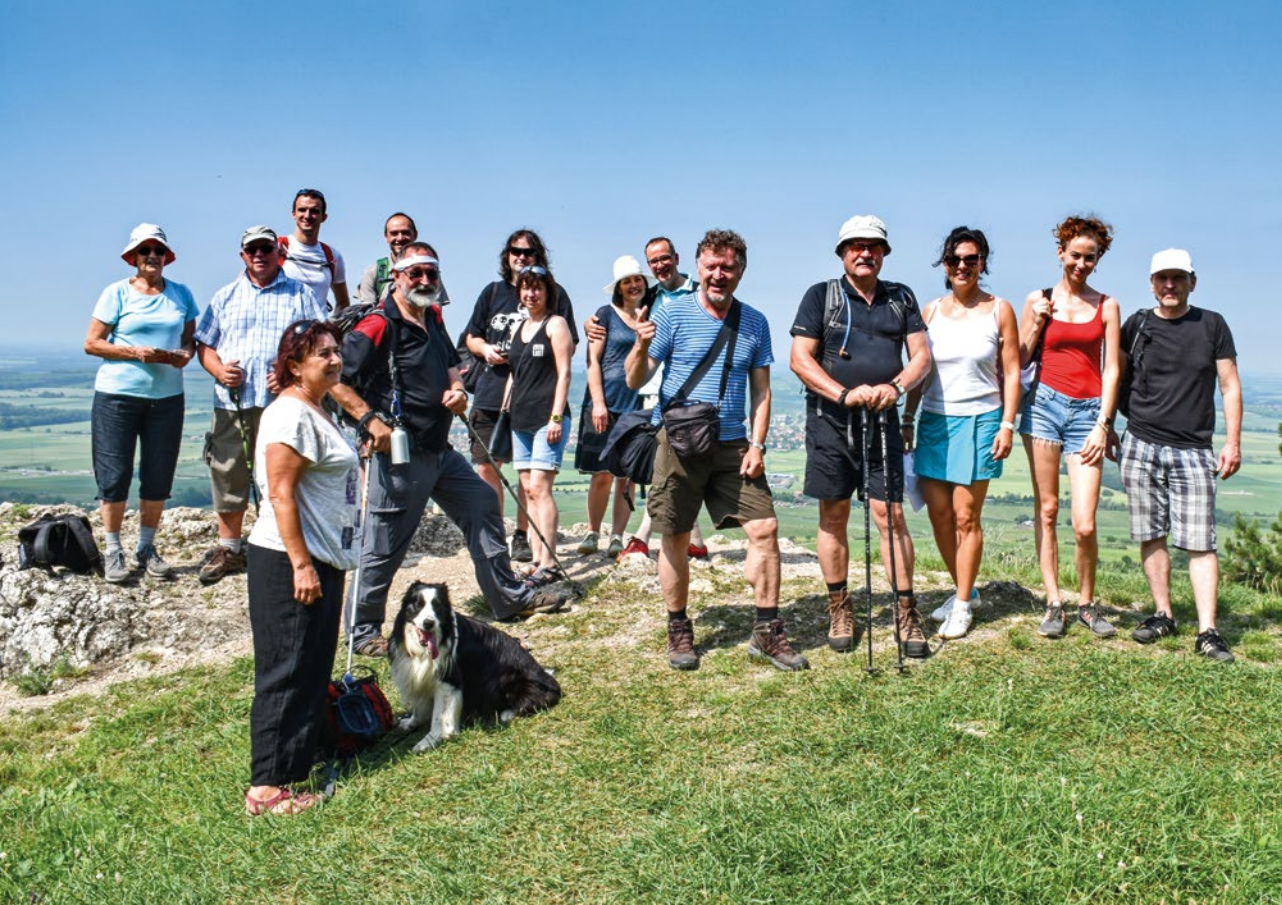
Pojďte s námi na Pálavu | Pěší výlet s návštěvou vinného sklepa – 13. 6. 2019