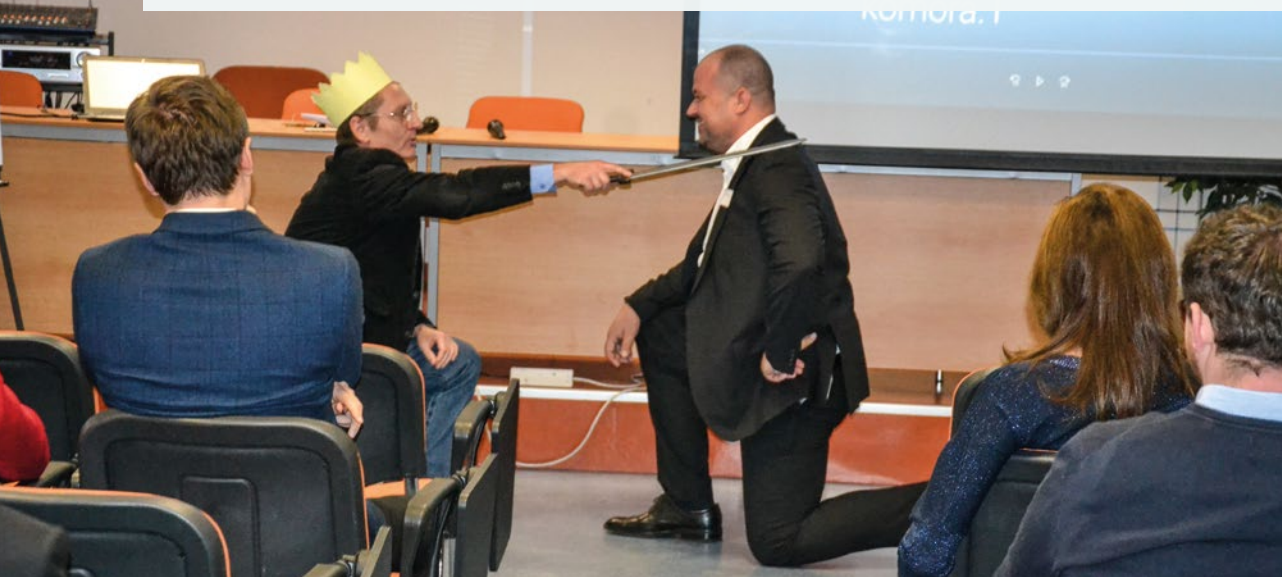
Pasování nových členů | Kooperační burza – 5. 12. 2019 – RHK Brno