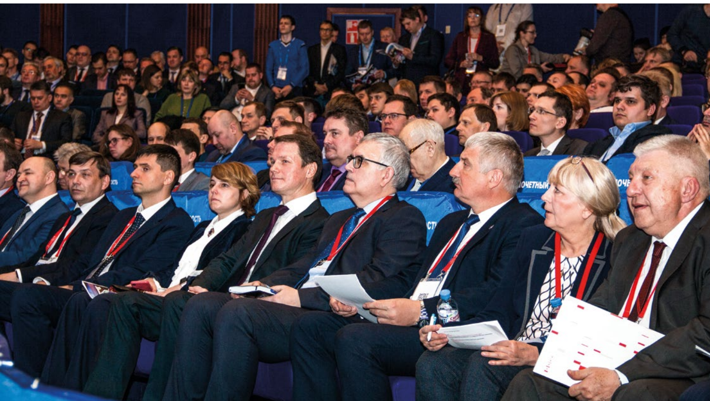
Podnikatelská mise do Jaroslavské oblasti | 14.–17. 4. 2019