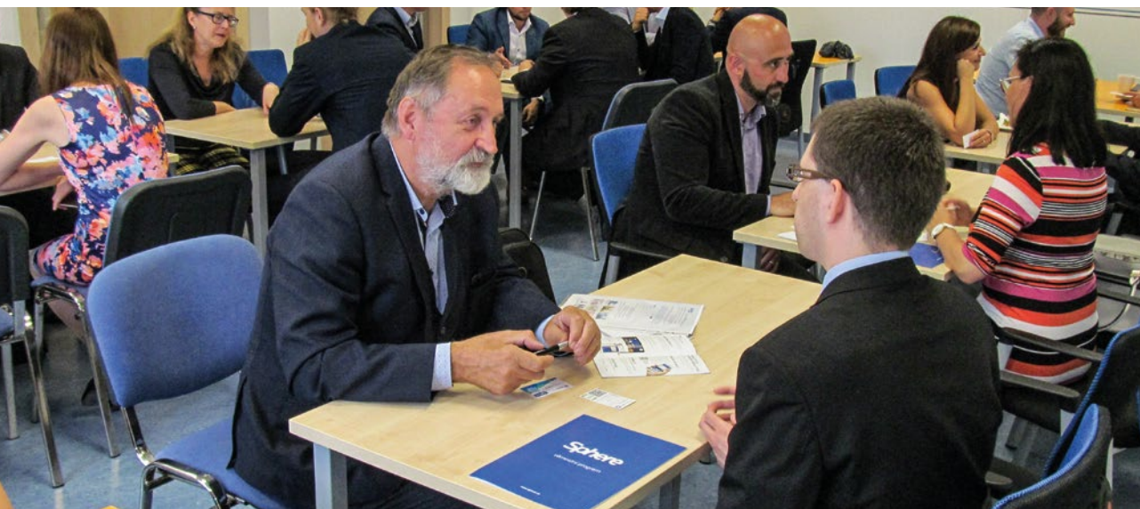
Pasování nových členů | Speed business meeting – 29. 5. 2019 – RHK Brno

V roce 2020 budou realizována dvě pasování nových členů, která na Vaše přání opět spojíme s kontaktními akcemi typu speed business meeting a kooperační burza.