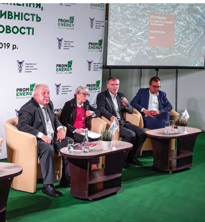
Podnikatelská mise do Charkova 25.–27. 9. 2019