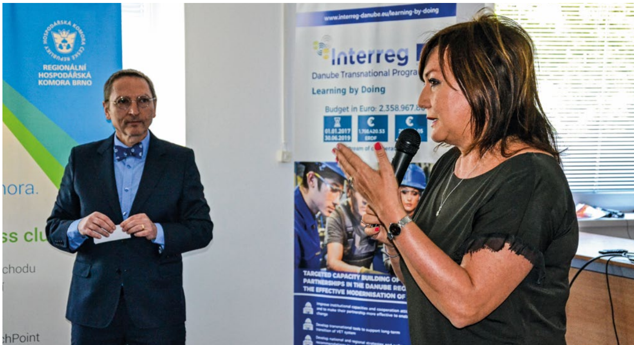
Setkání s ministryní financí Alenou Schillerovou | 24. 5. 2019