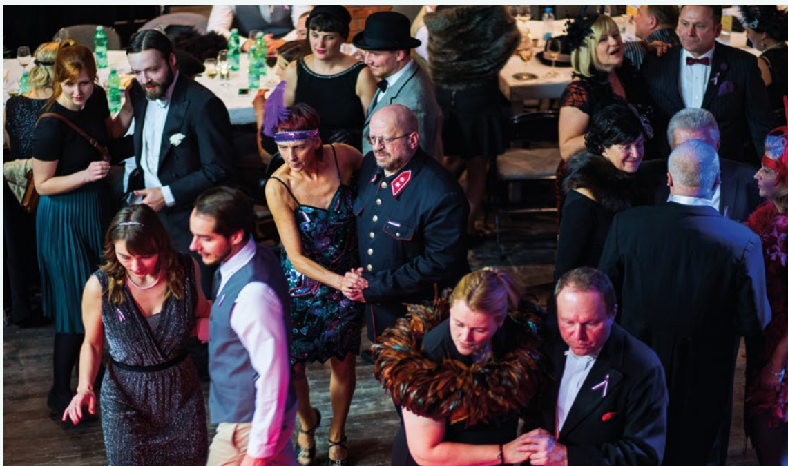
Čtvrtý první podnikatelský retroples | První republika – Divadlo Husa na provázku – 11. 1. 2019