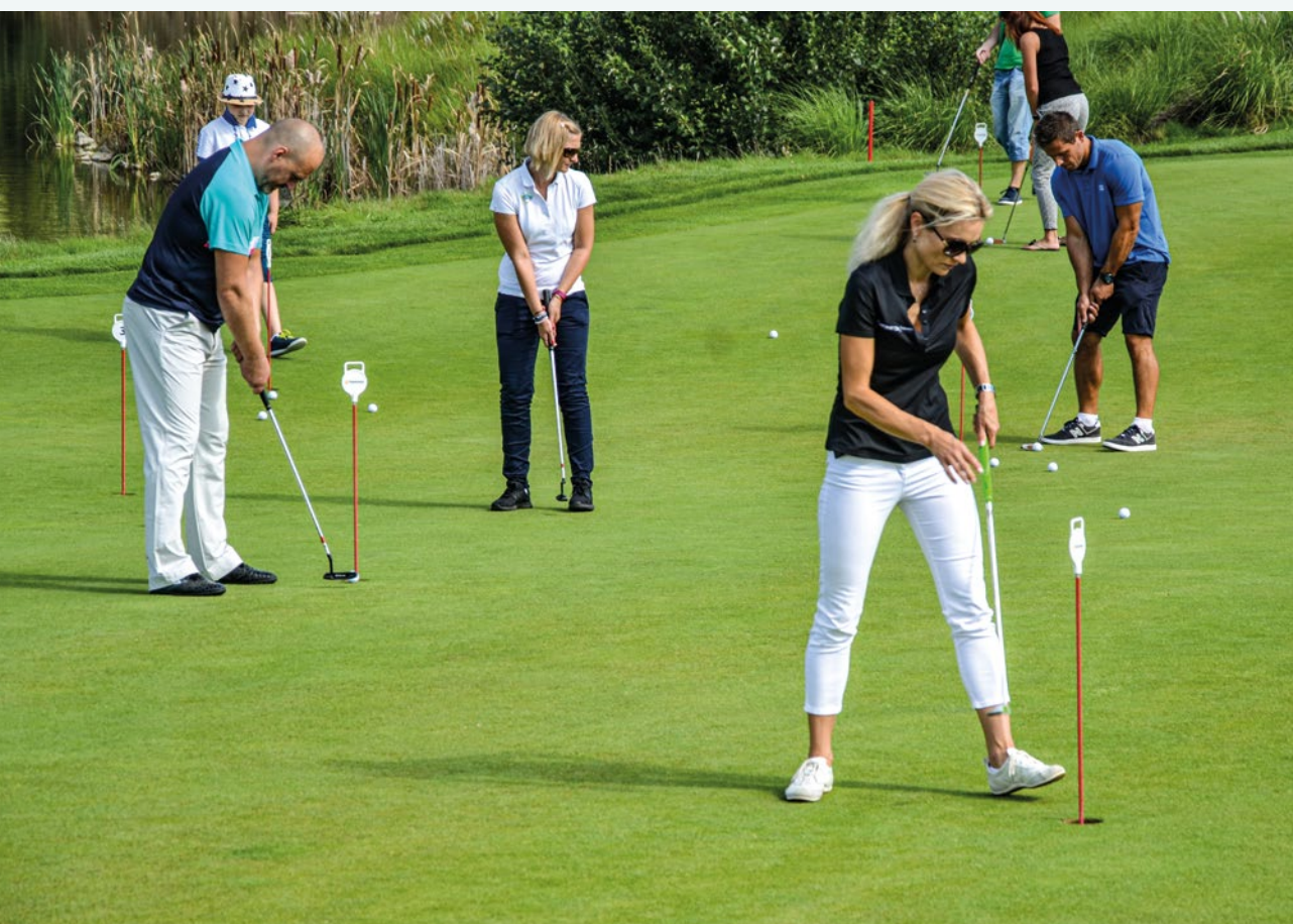
69. podnikatelské setkání | Golfové hrátky 2019 – Golfový resort Kaskáda – 5. 9. 2019