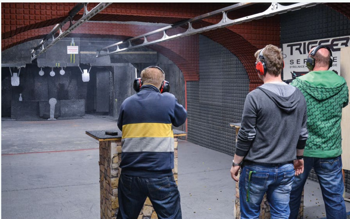
68. podnikatelské setkání | Business trefa – TRIGGER Service, s.r.o. – 23. 3. 2019