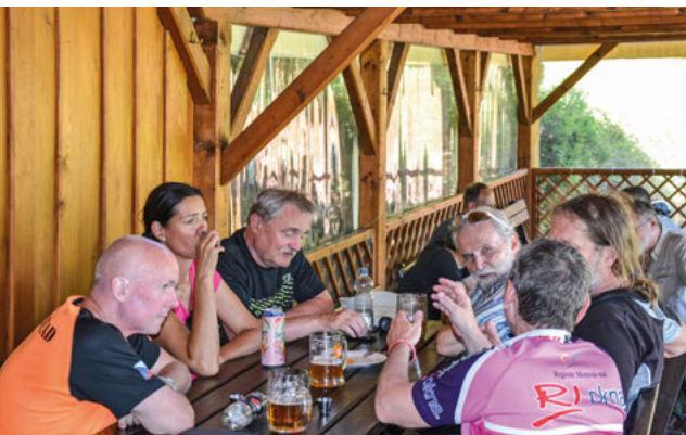
Mariánským údolím na kole i pěšky