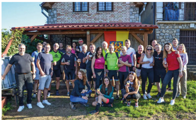
Z Lovčiček do Šidlen