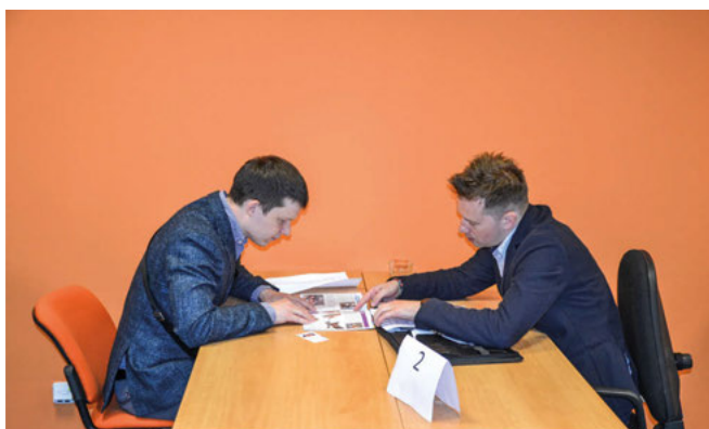
Kooperační burza při pasování nových členů