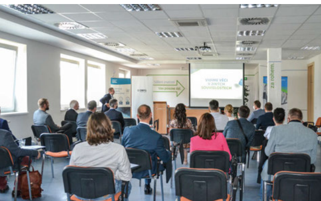
Pasování nových členů