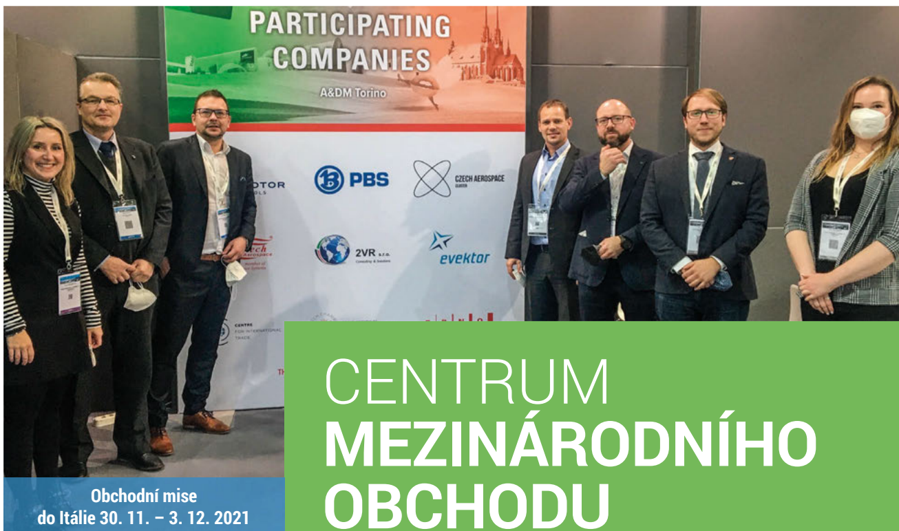
Obchodní mise do Itálie 30. 11. – 3. 12. 2021