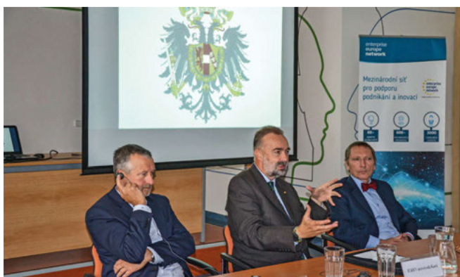
Setkání s arcivévodou Karlem Habsbursko-Lotrinským