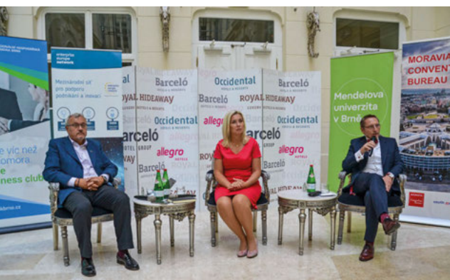
Duel – Danuše Nerudová × Vladimír Dlouhý