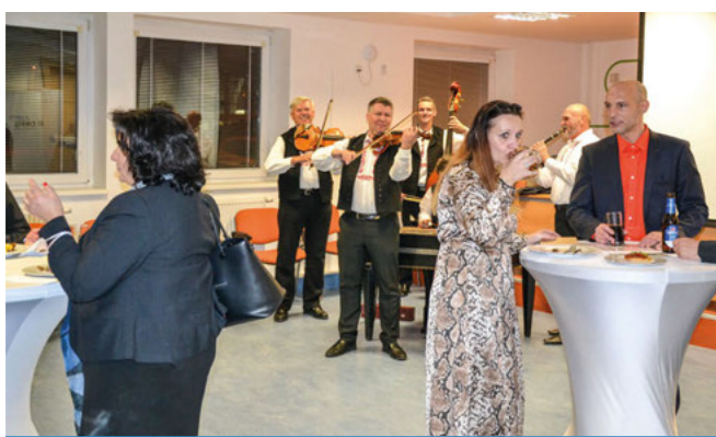
Podnikatelské setkání při akci Kontakt-Kontrakt