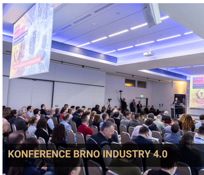
KONFERENCE BRNO INDUSTRY 4.0