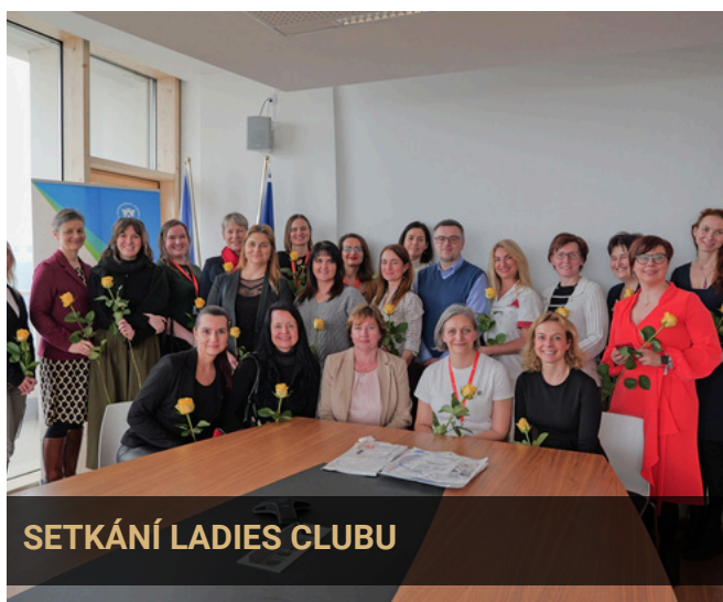
SETKÁNÍ LADIES CLUBU