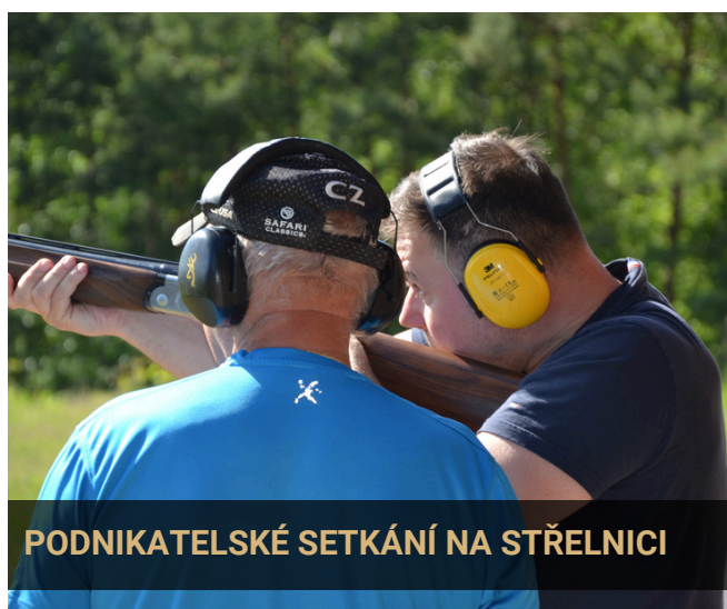
PODNIKATELSKÉ SETKÁNÍ NA STŘELNICI