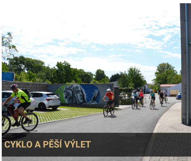
CYKLO A PĚŠÍ VÝLET