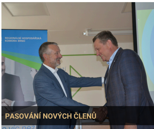
PASOVÁNÍ NOVÝCH ČLENŮ