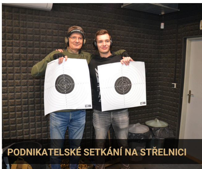
PODNIKATELSKÉ SETKÁNÍ NA STŘELNICI