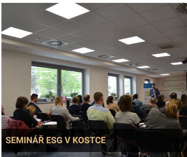
SEMINÁŘ ESG V KOSTCE